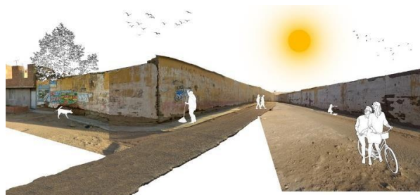
Figura 4. Lado norte de la huaca del Pueblo Joven Santa Rosa. Se identifica una barrera arquitectónica que consiste en el muro perimetral de protección del monumento arqueológico prehispánico. Esta estructura muestra una clara falta de integración con su entorno inmediato.

La segregación de las huacas en algunas ciudades del país suele ser el resultado de la falta de integración y conexión con las dinámicas urbanas circundantes. En el caso particular de la ciudad de Lambayeque, la Huaca del Pueblo Joven Santa Rosa se encuentra inmersa en el tejido urbano, pero su vinculación con este entorno es insuficiente.