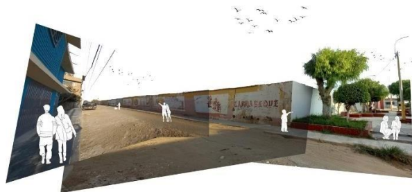
Figura 3. Lado norte de la huaca del Pueblo Joven Santa Rosa. Se identifica una barrera arquitectónica que consiste en el muro perimetral de protección del monumento arqueológico prehispánico. Esta estructura muestra una clara falta de integración con su entorno

La producción humana de objetos arquitectónicos en territorios y ciudades a lo largo del tiempo deja una huella física que adquiere un valor histórico y simbólico, incorporándose al patrimonio cultural en forma de huacas o ruinas. Sin embargo, en el proceso de valoración, estos objetos evolucionan hacia un estado de "culto", donde se les otorga principalmente un valor contemplativo. En este punto, las disciplinas de conservación e intervención arquitectónica y arqueológica revelan su lado menos efectivo, ya que tienden a limitar la activación de estos objetos, lo que a su vez conduce a una desaparición gradual del patrimonio. Esta pérdida resulta en la desconexión de la sociedad con su herencia cultural y su sentido de pertenencia.