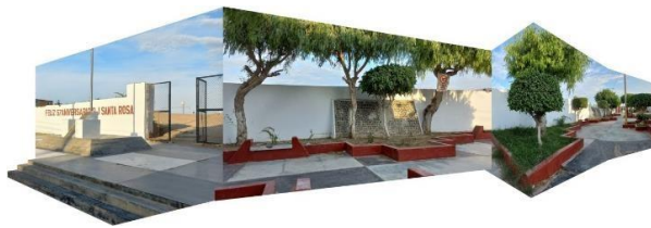
Figura 5. Espacio público inactivo. Lado oeste de la huaca. Se observa un espacio público con connotación cívica y en donde se ha brindado un acceso al patrimonio.

también se enfrentaron desafíos relacionados con la escasez de espacios públicos e infraestructura urbana. Crousse identificó una correlación entre las tipologías del paisaje y los sitios arqueológicos, proponiendo estrategias para transformar la ciudad al aprovechar los sitios arqueológicos como oportunidades para crear espacios públicos con un valor cultural destacado. Esta propuesta ayudaría a compensar la falta de áreas verdes en la ciudad, y sus conclusiones coinciden con los resultados de la presente investigación.