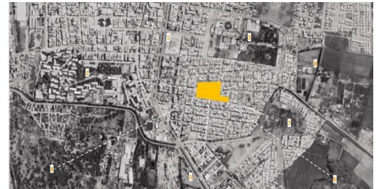
Figura 6. La huaca y su relación con el entorno y sus equipamientos: La Universidad Nacional Pedro Ruiz Gallo, El museo nacional Tumbas Reales, El parque infantil y el mercado de abastos.

Durante estas conversaciones, los entrevistados enfatizaron la relevancia de involucrar de manera activa a la comunidad en las acciones relacionadas con monumentos arqueológicos. Hicieron hincapié en la importancia de transformar el monumento en un recurso que contribuya tanto económicamente como a la consolidación de la identidad local, a través de la colaboración de la comunidad y su integración efectiva en el contexto urbano circundante.