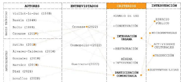
Figura 7. Criterios de intervención en preexistencias patrimoniales. Basados y respaldados por expertos y especialistas. Se busca una integración desde los puntos urbano, paisajístico y memoria como

Estos hallazgos subrayan aún más la importancia de la participación comunitaria en proyectos relacionados con el patrimonio. Destacan la necesidad de fomentar la colaboración y el compromiso de la comunidad en la conservación y revitalización de sitios arqueológicos. Los criterios de intervención propuestos en esta investigación van más allá de las medidas convencionales establecidas por la normativa, buscando no solo la conservación física de los vestigios arqueológicos, sino también su integración significativa en la vida cotidiana de las comunidades locales.