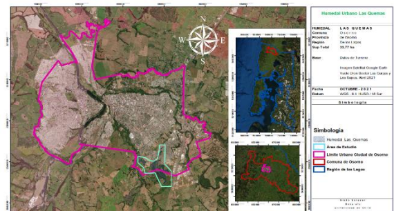
Figura 1: Localización del área de estudios, correspondiente al sector sur oriente del área urbana

El caso de estudio de este trabajo corresponde al Sistema de Humedales Urbanos las Quemadas, un sistema hídrico que se emplaza en el sector sur oriente del área urbana de la comuna (Figura 1) y que está compuesto por diversas áreas fragmentadas entre sí, las que en conjunto prestan una serie de servicios ecosistémicos, de tipo físico como también sociales. Esta área se encuentra asociada al Estero El molino, actualmente un paleoestero, el cual es reconocido en diversos documentos históricos de la comuna.